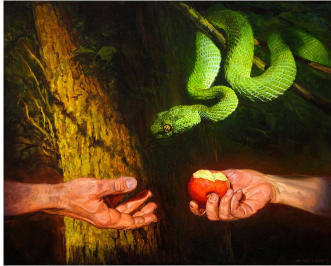
De zondeval - Jan van 't Hoff The Fall of man - Gospel Images