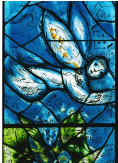
Marc Chagall - Engel

Heb ik een engel gezien en als ik 'neen' zeg hoe geloofwaardig zijn dan de verhalen waarin de Malach Adonai – boodschapper van God – verschijnt?