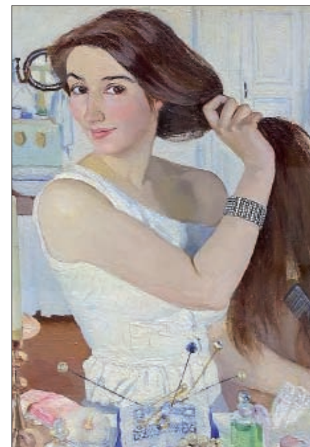
Zelfportret van Serebryakova

Toen ze daar naar binnen liep, brak er iets in haar stoere gedrag. Ze moest vreselijk huilen. Enerzijds was ze bang dat de men-