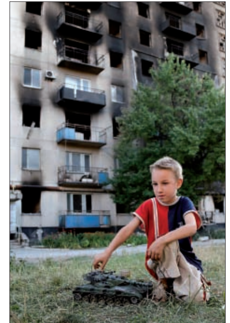
Kind speelt met speelgoedtank in Kurakhove, Donetsk.

vraag: "ben je veilig daar, in de opvang in Warschau?" Ja, hij is daar veilig. Daar gaat hij dan, dag Otto, bedankt voor je gevecht tegen de angst.