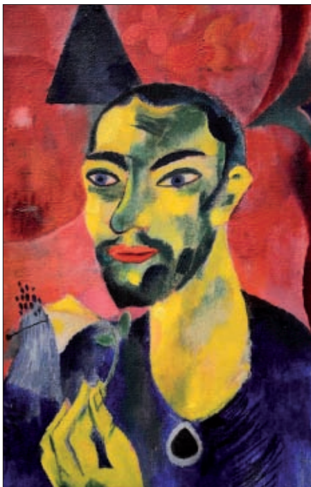
Henri Campendonck, man met bloem

Den Haag speelt een belangrijke rol. Bij ons is het Vredespaleis en het Internationaal Strafhof. En ook het onafhankelijke Permanente Hof voor Arbitrage. Ik hoop dat we beginnen met praten met Russi-