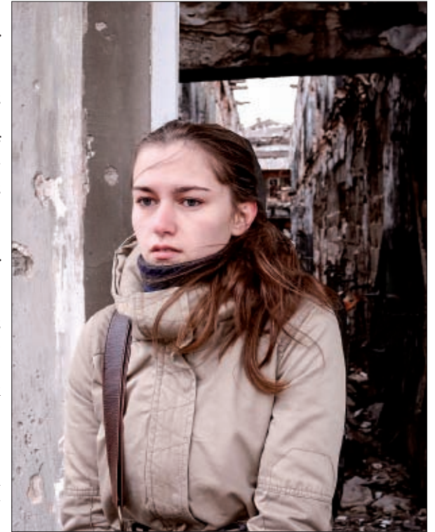
meisje voor kapotgeschoten huis in Lugansk

“Vanaf 2020 waren de dialoogsessies vooral cross border in Rusland en Oekraïne, maar na de inval van Rusland in 2022 is dat gestopt (hopelijk tijdelijk). We zijn dialogen gaan organiseren met mensen uit