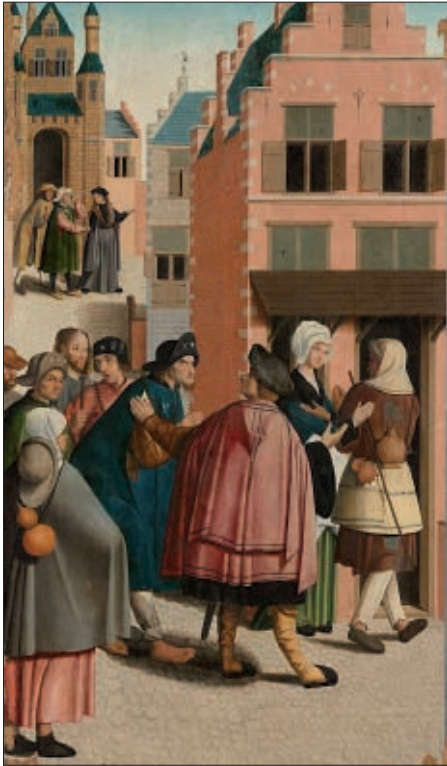
werken der barmhartigheid: vreemdelingen huisvesten

niet anders dan naar een opvangcentrum gaan, daar worden ze dan geregistreerd en wachten daar op een officiële status. Sommigen hebben geen papieren en zijn dus sowieso “illegalen”. Er is ook een spreidingsbeleid, net als bij ons.