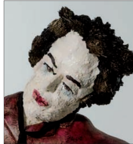
portret van Hannah Ahrendt

van hoe je ongeoorloofd excessief geweld kunt berechten en waar mogelijk bestraffen. Het ging daar om het vaststellen van de individuele verantwoordelijkheid van concrete mensen. Het hielp om een waanzinnig gewelddadige periode enigszins af te sluiten en de rechtsorde te herstellen. De filosoof Hannah Ahrendt schreef over het proces tegen Eichman in haar boek: “De banaliteit van het kwaad”. Het bleek dat heel gewone mensen meegewerkt hadden aan de meest verschrikkelijke dingen, uit volgzzaamheid, zonder te beseffen wat ze aanrichtten. Het koude zweet breekt me uit. Wat wil ik nu eigenlijk zeggen en wie ben ik zelf nu