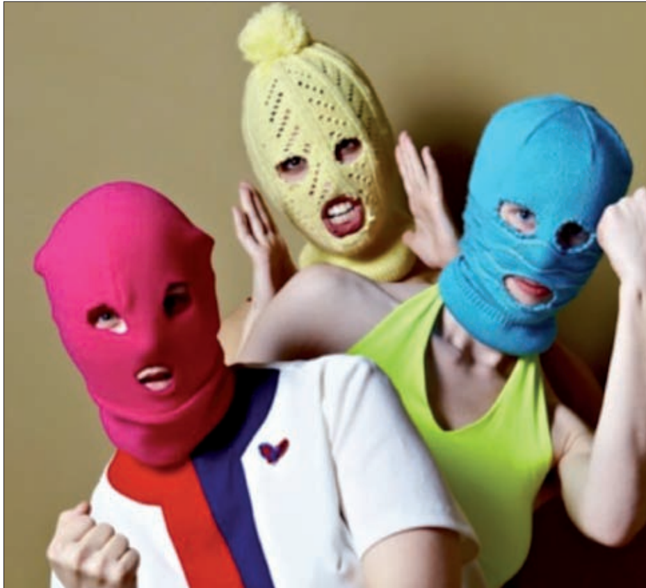
De Pussy Riot groep

We kunnen merken dat het haar hevig aangrijpt, maar ze houdt zich stoer. Wat kun je meer doen dan elkaar omhelzen? Ik probeer: "je dochter is lastig, maar dat is vast omdat ze een sterk karakter heeft net als jij. Ze gaat het redden!"